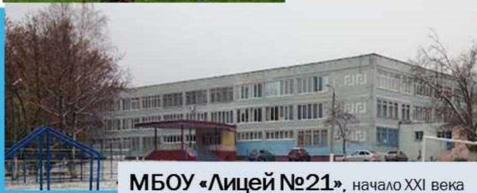
МБОУ «Лицей №21», начало XXI века